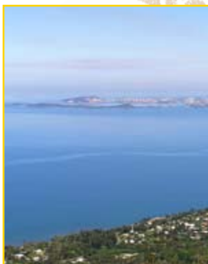
Vue sur Nouméa