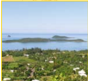
Les îlots Bailly, Charon et Porc Epic

Le Mont Dore fut le témoin des préludes de l'histoire passionnelle qui lie la Nouvelle-Calédonie au vieux Nick : ce fut le tout premier site minier à être exploité. Une véritable ruée vers l'or vert y eu lieu dès 1873, suite à la découverte d'importants gisements de nickel. Malgré les tentatives récentes de reboisement, les flancs pelés et la végétation clairsemée du Mont Dore attestent encore des ravages de la mine.